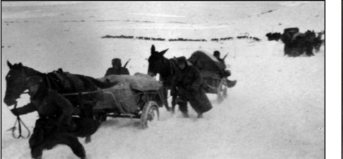
Snøstorm ved Litsa, med orkanbyger som varte i tre dager. Mange soldater, både sovjetiske og tyske, frøs i hjel.