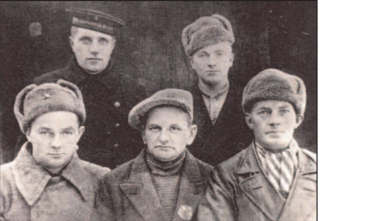
Partinasergruppene blir avslørt, tatt til fange, og mange blir drept.