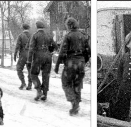
Frigjøring. Rundt 320 sivile finnmarkinger var drept på grunn av krigen. I tillegg ble mange drept av miner etter krigen.