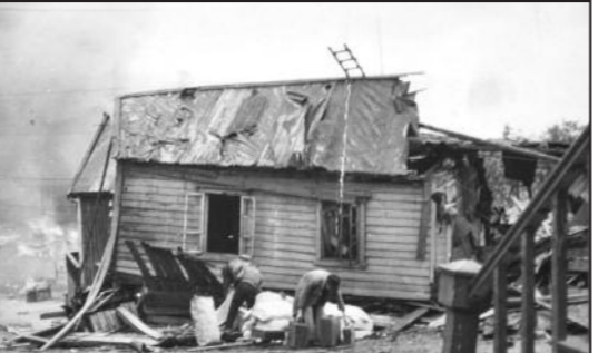
Vardø blir bombet. Ni mister livet.