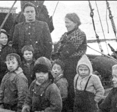
Tragedien på Hopseidet