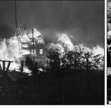
Etter forslag fra Terboven gir Hitler ordre om tvangsevakuering og brenning av Finnmark og Nord-Troms øst for Lyngen.