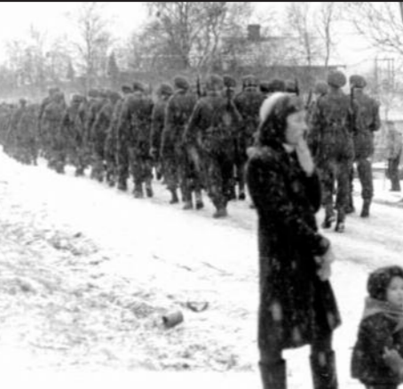
502 huleboere hentes ut fra Sørøya med Engelske destroyere og sendes til Skottland.