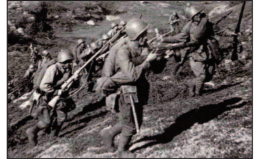
Tyskland går inn i Sovjet via Petsamo. Dietl leder operasjonen som kalles; Operasjon Platinfuchs.