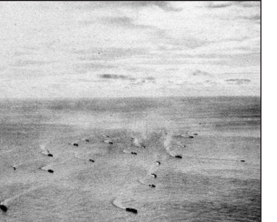
Første konvoi går fra England til Murmansk. 43 konvoier gikk fra vest mot øst. 34 konvoier gikk motsatt vei. 104 handelsskip og 20 allierte krigsskip gikk tapt. Mellom 1000 og 1500 mennesker omkom. Sovjet fikk 500 tanks og mer enn 7000 fly – i alt 4 millioner tonn våpen, ammunisjon og andre forsyninger med de nordlige konvoiene.