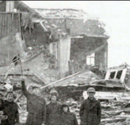
De siste Sovjetiske soldatene forlater Finnmark