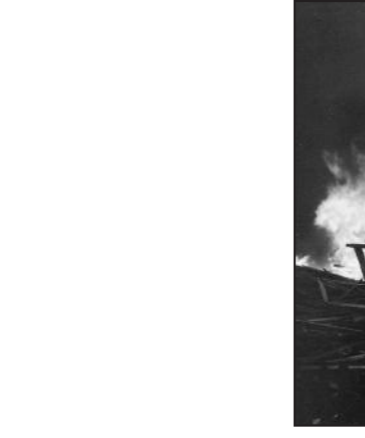
Vadsø blir bombet av over 100 sovjetiske bombefly. 13 mennesker mistet livet.