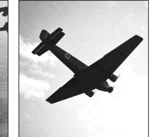
Tyskland okkuperer Norge.