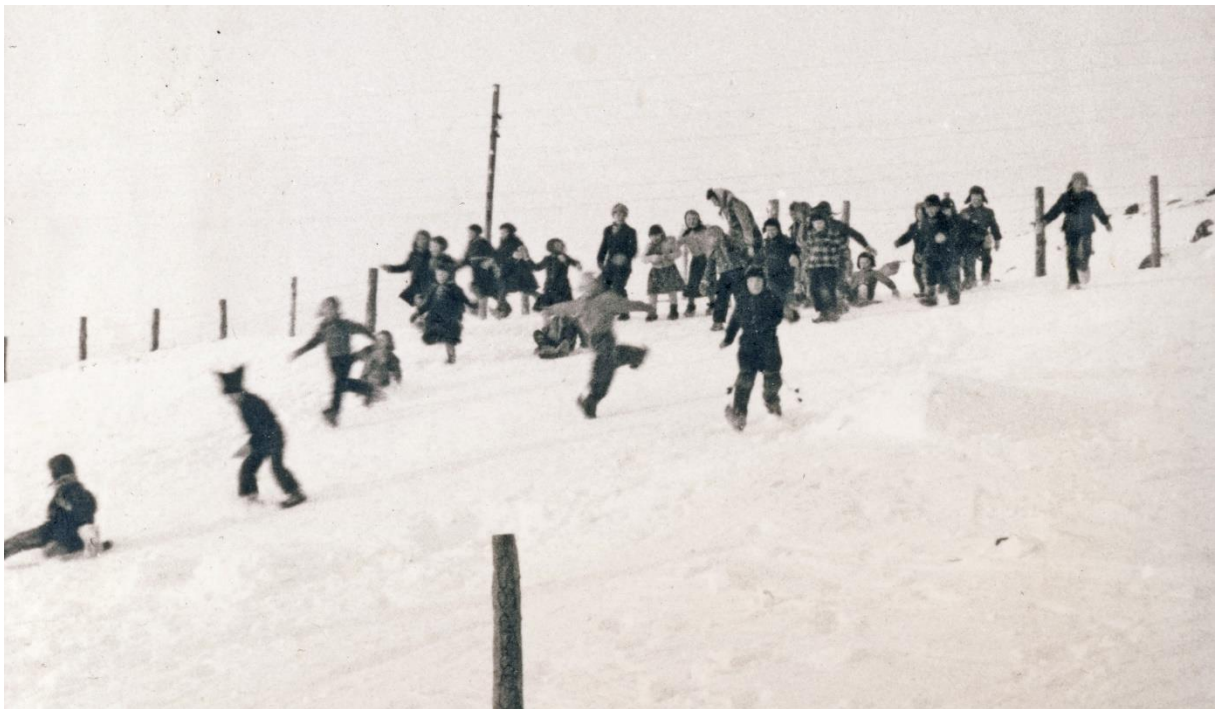
Mánát stohke ja čierastalle dolin maddái. Dás čierastallamin sabehiiguin, duljiiguin ja goikkehiiguin/nuvttuhiiguin.